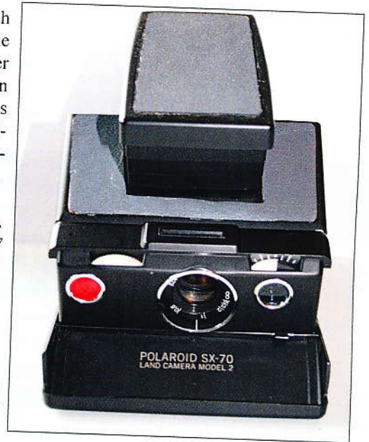
Abb. 3: Polaroid Land Camera, SX 70 in grauer Belederung, Sammlung Willi Wilhelm

© Text und Abbildungen Willi Wilhelm, Bornheim 2017